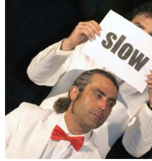
out of mind