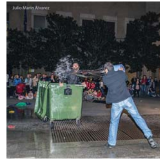
el viaje más caro