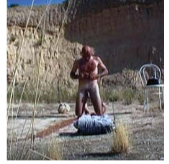
the muddy man