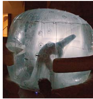
out of mind