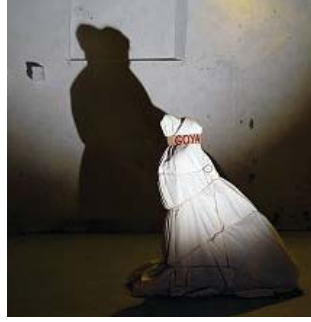
gil & oliden