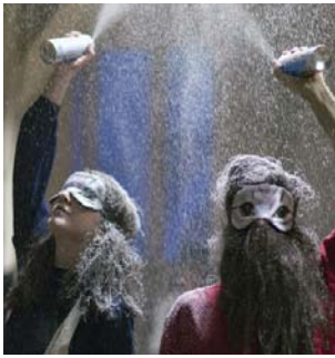
grimsgaard & muro