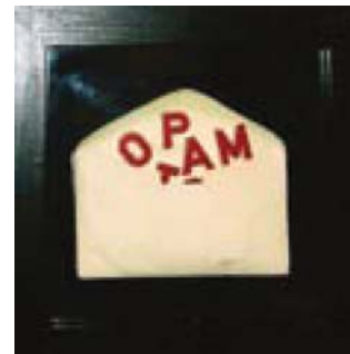
pierre d la.