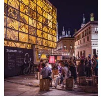
noche en blanco