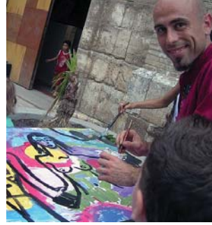
talleres red bibliotecas