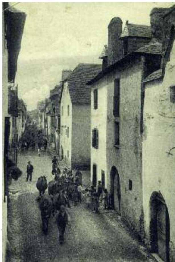
A vender las mulas a Francia. Calle Mayor de Canfranc, Camino Real hasta 1877.

Por supuesto, no están todos ni todas, pero sí los más representativos. Ahora es tiempo de entrar en acción, indaga sobre todos estos artistas y mientras tanto ¡HAZ UNA PERFORMANCE!