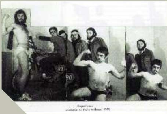
Grupo Forma. 1975.

tasía de la Ribera, donde colaboran artistas de distintas disciplinas como la soprano Pilar Marqués .